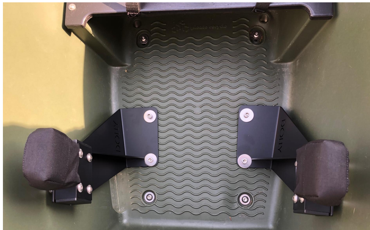
Maxi Cosi houder Deluxe montage